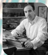
Яковлев Юрий Яковлевич

советский писатель и сценарист, автор книг для подростков и юношества